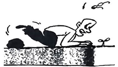
一个快乐的失败者，本身就是另一个胜利者