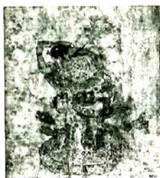
尉迟乙僧“(龟兹)舞女”