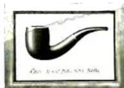
《图像的背叛》(马格利特 1929)