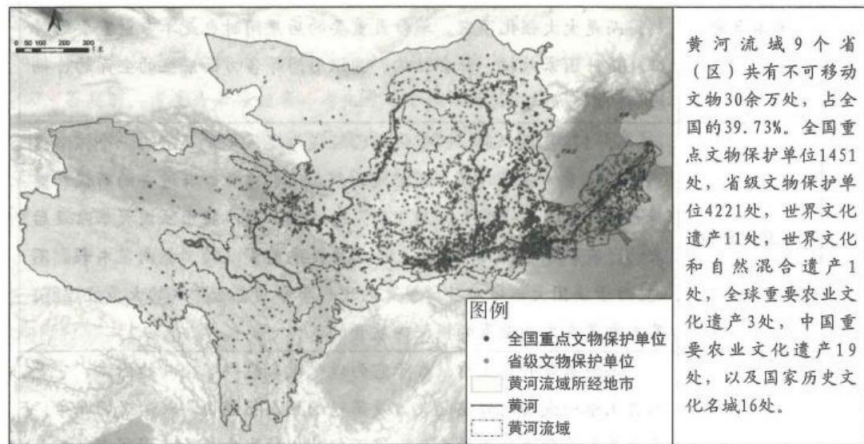
图4 黄河流域重要文物资源分布图