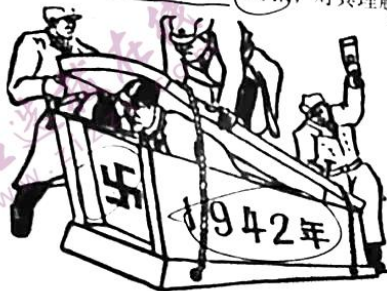
苏联送给希特勒的礼物