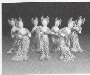
唐代乐俑文物图片

22. 舞蹈《唐宫夜宴》创作灵感来自1959年河南安阳张盛墓出土的古代乐舞俑,“……一组唐代乐俑,给我留下的印象非常深刻,我就想象它这种形态,如果是在博物馆里面‘活’起来,把我们带到一千多年以前,会是什么场景?”创作者说。14名女舞蹈演员,用婀娜多姿、秀逸韵致的舞姿将大唐盛世的传统文化形象完美地呈现在舞台上,让观众在欣赏“鬓云欲度香腮雪,衣香袂影是盛唐”的别样丰腴身韵审美风姿的同时,感受中华厚重的历史和文化。该舞蹈剧的创作