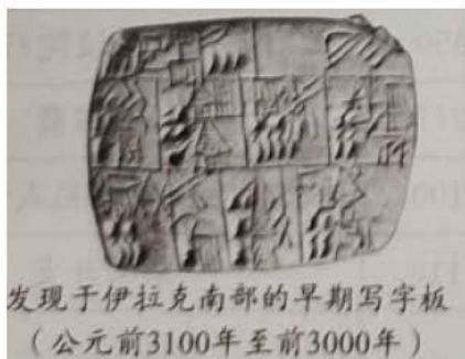
发现于伊拉克南部的早期写字板 (公元前3100年至前3000年)