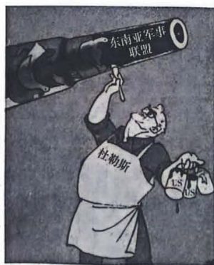
注:杜勒斯为时任美国国务卿。