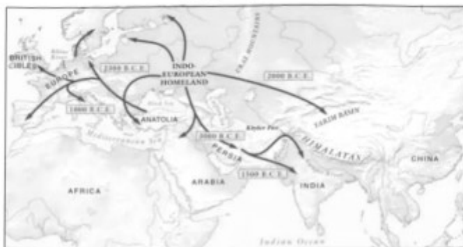
古印欧人的迁徙示意图