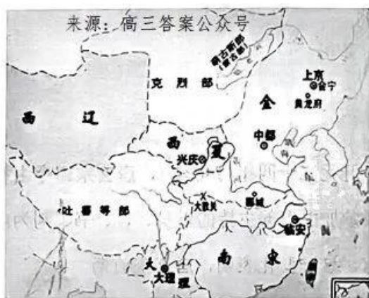
金、南宋并立形势图