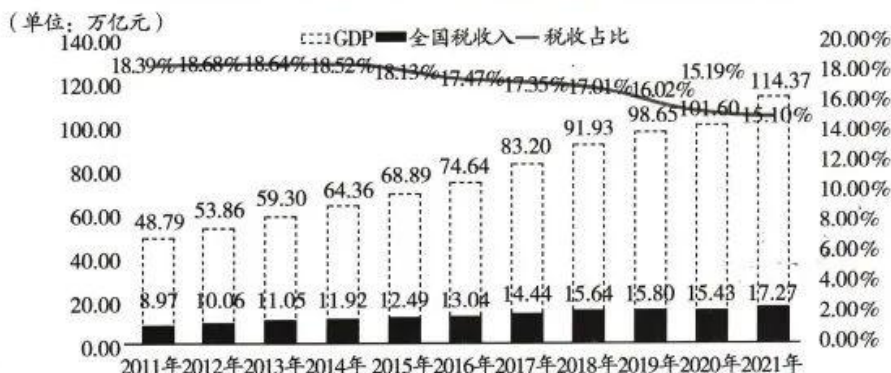
2011—2021年我国国内生产总值、全国税收收入及税收占比

注:税收占国民收入的比重(税收占比)是衡量税收相对规模和税收的负担水平的指标之一。