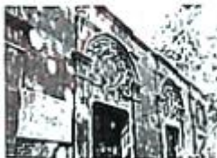
图4 中共一大会议址