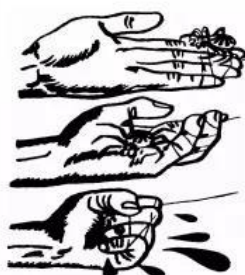
《候敌深入，一鼓歼灭》