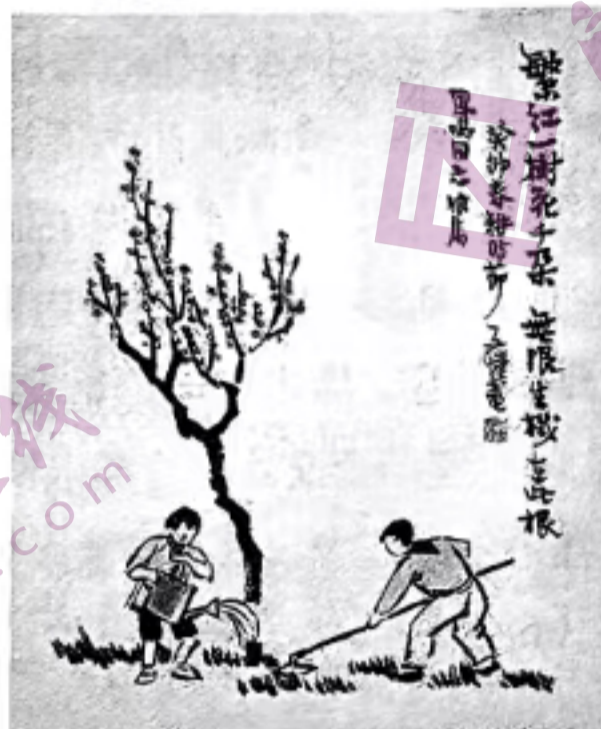
繁红一树花千朵 无限生机在此根 丰子恺画作