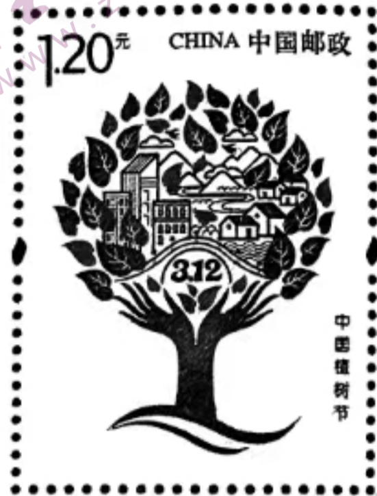
中国植树节40周年纪念邮票 中国邮政发行

（2）活动中，同学们就“耕耘与收获”展开了热烈讨论，有的同学认为“只问耕耘，不问收获”，有的同学认为“欲问耕耘，必问收获”。你同意谁的观点？请写一则发言稿，参与讨论。要求：观点明确，自圆其说。