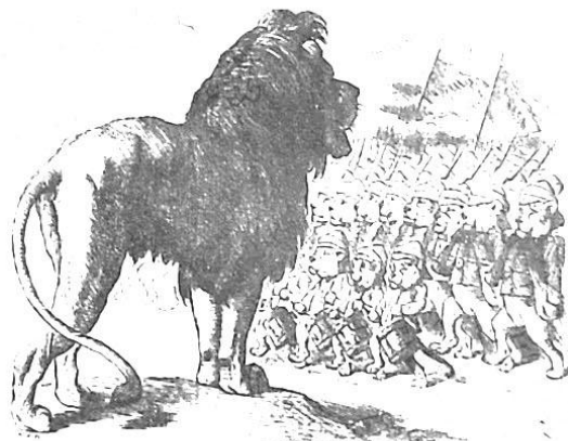
图 4: 1914 年英国漫画《我的孩子们》

15. 读图 4: 图中雄狮象征英国, 敲鼓、举旗、扛枪列队的小狮子象征英国人民及殖民地。