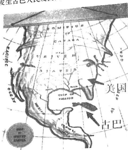
图 3: 《我盯着这块肉很久了, 想不吃都不可能》

14. 读图 3: 1895 年发生古巴人民反抗西班牙殖民统治的战争, 美国积极支持古巴人民。