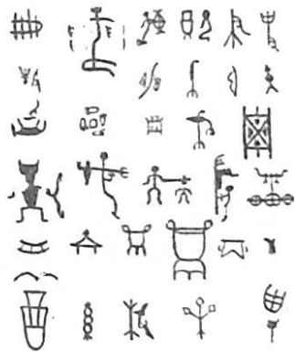
图 1: 与职业有关的族徽