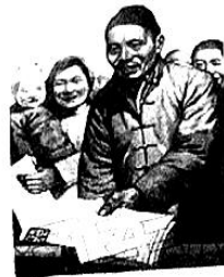
图2《迎接农业合作化高潮!》(1956年)

结合图片创作的时代背景,自拟论题,写一篇历史评析短文。(要求:论题明确,史论结合,逻辑清晰)