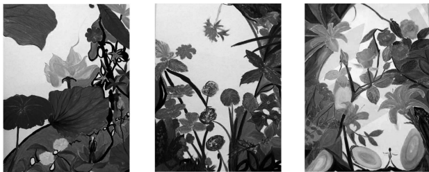
图4 《深灵》系列之十二、二十七、三十

19. (9分) 一位画家、作家创作了取材中药材的油画系列《深灵》，并记录下自己的感悟。