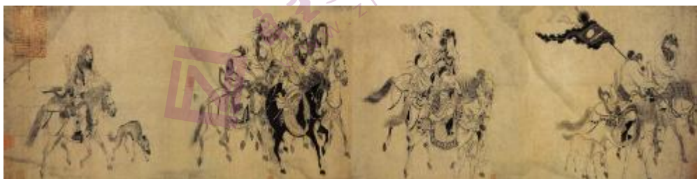
图 1 南宋·宫素然《明妃出塞图》

9. 如图 1，宋代边塞诗画重在渲染昭君的悲剧与国家的耻辱。但元代虞集评论说，“天下为家百不忧，玉颜锦帐度春秋；如何一段琵琶曲，青草离离咏未休”。此种格调渐成元代番族类题画诗的主流基调。这一变化反映了