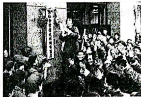
图 2:某丝绸店挂上公私合营的招牌