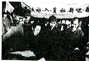
图 1:农民踊跃报名加入农业生产合作社