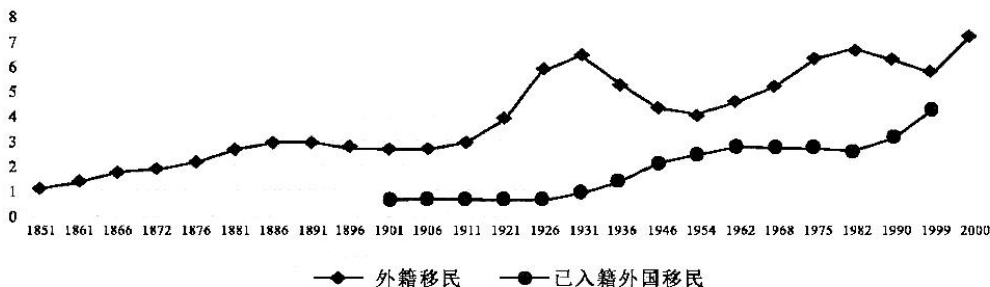
移民在法国总人口中所占百分比(1851—2000年)