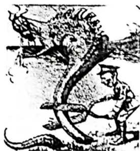
尾巴上文字: 东四省(黑吉辽热河)