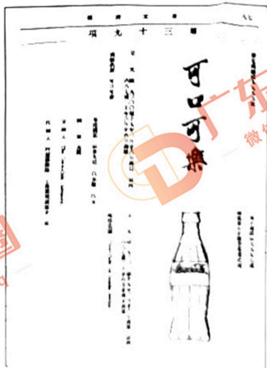
图 1 1935 年可口可乐公司在中国注册的“蝌蝌啃蜡”注册商标档案文件