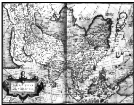
图1 奥特柳斯《亚洲新描述》， 1570年版《寰宇大观》