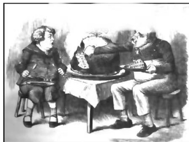
《贪吃的男孩》(1885年) 作者: [英]约翰·坦尼尔