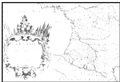
图3 1701年《法兰西地图》的题铭 与比利牛斯山部分