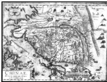
图2 奥特柳斯《中国图》， 1584年版《寰宇大观》

《寰宇大观》中的亚洲总图(图1), China 只居于南方的广东附近,而 Cataio 与 China 并列,居于北方。显然,这是将 China 等同于马可·波罗提到的 Mangi(“蛮子”)。