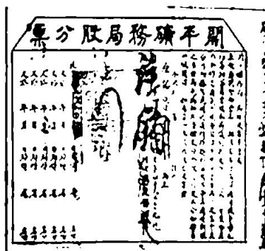
图5 开平矿务局股票

(注：图5股票右侧文字为：“开平矿务局为给股票事，奉直隶总督部堂李(李鸿章)批准设局，招商开采煤铁等矿，札飭筹办等因，当经本局议定，先后召集股银120万两，分作12万2千股……”。)