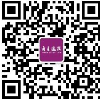
识别二维码，快速关注

如需第一时间获取相关资讯及备考指南，请关注 自主选拔在线 官方微信号： zizzsw 。