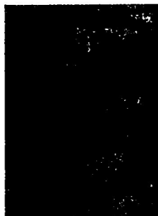
湖南长沙子弹库帛画《人物御龙图》局部 图2