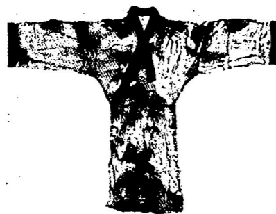
湖北江陵马山楚墓素纱绵衣 图3