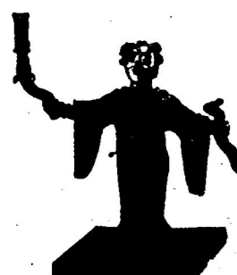
河北中山王陵人形铜灯局部 图1

1. 春秋战国时期,从南到北流行将身体严密包裹起来的“深衣”,但深衣的具体形制以往并不清楚;如下图,通过现代考古,考古学家发现了许多准确的深衣式样。据此可知