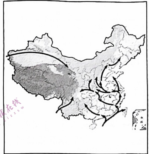
图3 明清时期各省引种玉米见于记载的年代