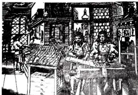
图一：谷登堡采用的金属活字印刷