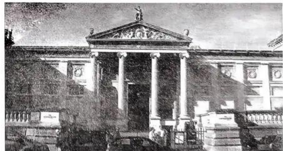
图二：阿什莫林博物馆

根据材料，结合所学知识，就材料整体或其中任意一点拟定一个论题，以“文化的传承和保护”为主题写一则历史短文。题目自拟。（要求：观点明确，史实准确，条理清晰，表述成文）（12分）