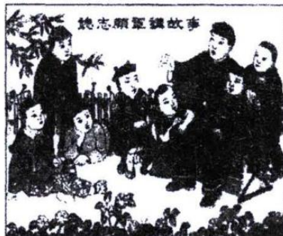
图 5 《听志愿军讲故事》

杨家埠位于山东省潍坊市东北, 其木版年画的历史已有 600 多年。杨家埠版画是我国著名的三大民间年画之一。图 5~图 7 是 20 世纪 50 年代杨家埠的木版年画。