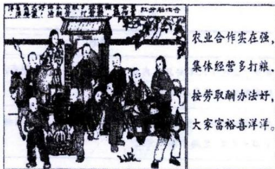
图 6 《合作社分红》