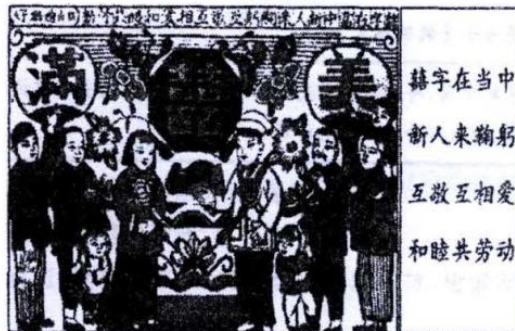
图 7 《自由婚姻好》

结合所学知识, 提取材料中的相关信息, 围绕“小年画·大历史”这一主题进行简要阐述。(要求: 史论结合, 逻辑严密, 条理清晰。)