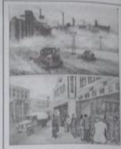
保证国民经济中社会主义 成分的比重稳步增长