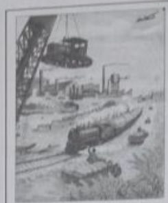
发展交通运输业轻工业 农业及商业