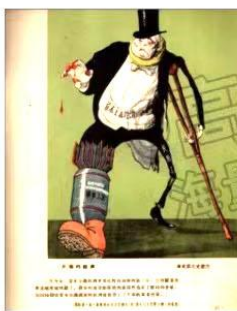
图 1 《片面的经济》