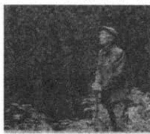
图4 “改革先锋”杨善洲

伫立在历史的画卷前，我们不仅感受到先辈们带来的精神洗礼，还仿佛看到了英雄们正在书写他们非凡的事迹。请提取材料和图片中的一个或多个信息，围绕“中华民族独特的精神”，自拟论题，结合所学，展开阐述。（要求：观点明确，史论结合，表述清晰。）