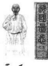
图2 魏源与《海国图志》