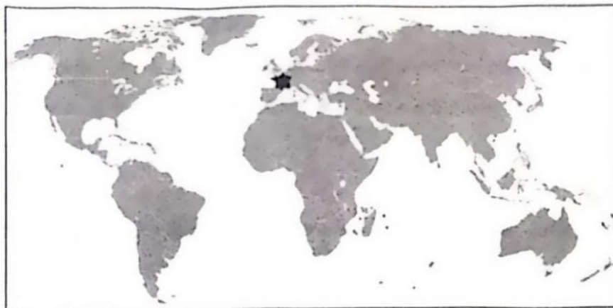
法国殖民地主要区域（19 世纪末 20 世纪初）