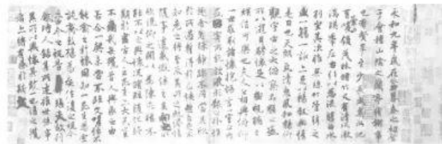
“天下第一行书”东晋王羲之《兰亭集序》(摹本)

16. 行书是介于草书、楷书之间的一种书体，书写流畅，不像草书那样难认，也不像楷书那样端庄，观察下图，可知行书的特征之一是