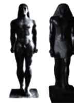
▲ 古代希腊和埃及的雕刻