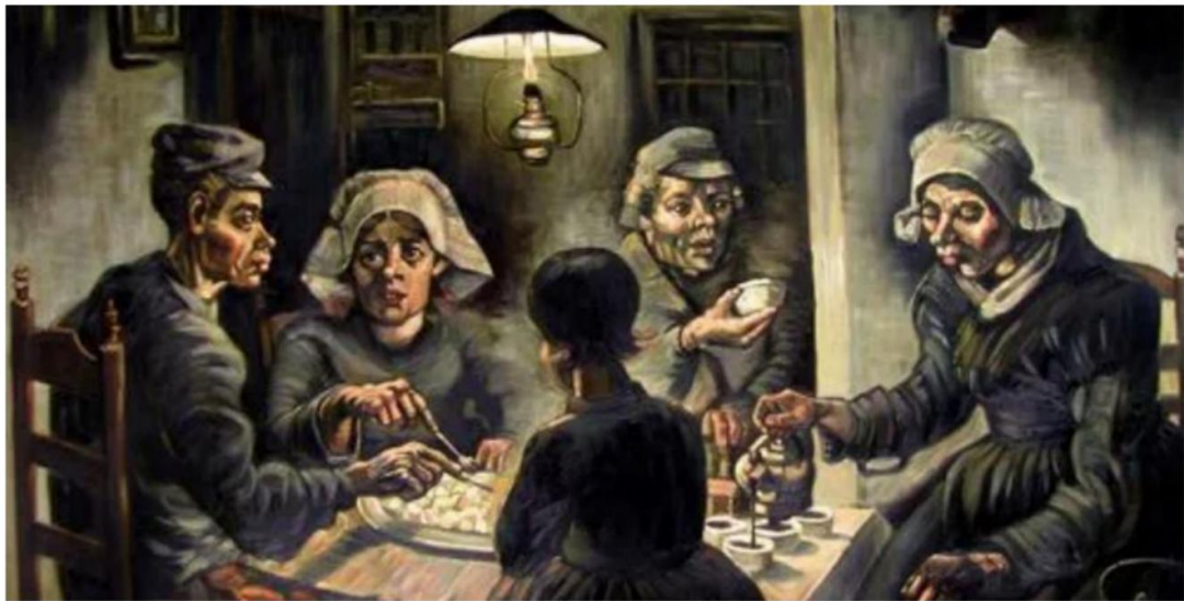
荷兰画家梵高 1885 年创作的油画《吃马铃薯的人》(第 11 题)

11. 这幅画描绘荷兰某家庭围坐煤油灯下, 年轻的女人面前有一大盘热气腾腾的蒸土豆, 对面老妇人在向杯中倒麦芽咖啡。他们生活贫寒, 却安详和平静。“我要告诉人们一种与文明人截然不同的生活方式”, 梵高说。关于该画历史背景, 说法正确的是 ( )