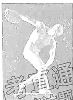
掷铁饼者 希腊雕塑

掷铁饼是一项古老的奥林匹克项目。以掷铁饼为题材的经典雕塑作品，从艺术的视角展示奥林匹克文化，阐释和传递奥林匹克精神。