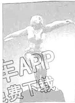
永恒的运转 中国雕塑