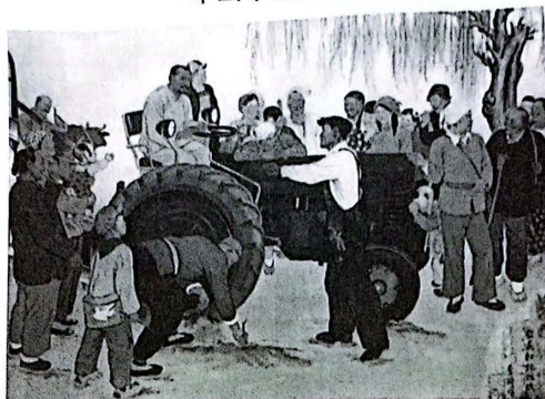
图3 《农民参观拖拉机》(1950年,李琦作)

结合所学知识,以“《农民参观拖拉机》赏析”为题写一则历史短文。(12分)(要求:表述成文,叙述完整;立论正确,史论结合;逻辑严密,条理清晰。)