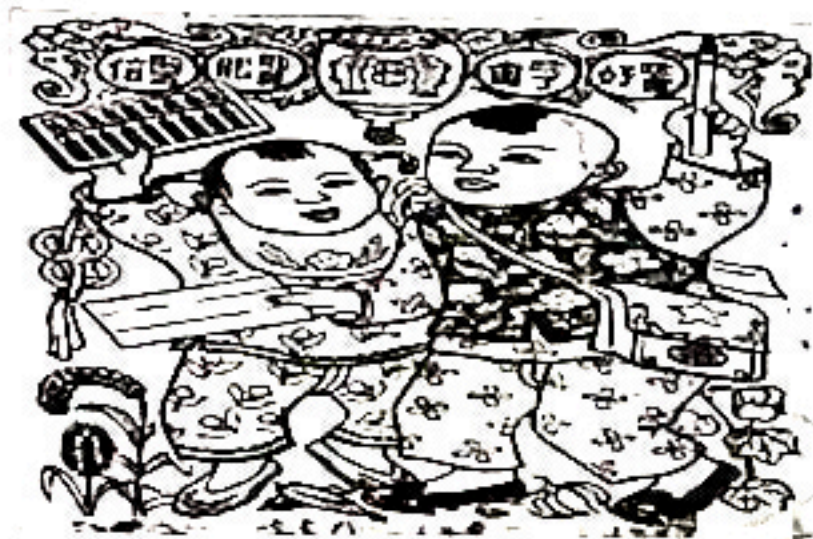
图三年画《念书好》，江丰（1944年）画图中文字为“念书好，念了书，能算账，能写信”