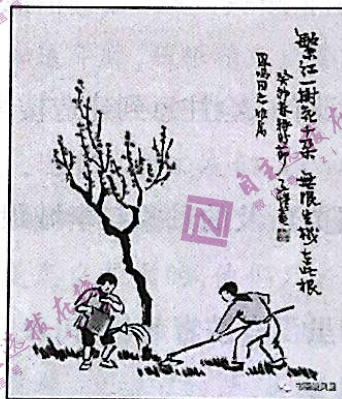
繁红一树花千朵,无限生机在此根 丰子恺画作