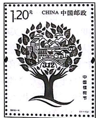
中国植树节40周年纪念邮票 中国邮政发行