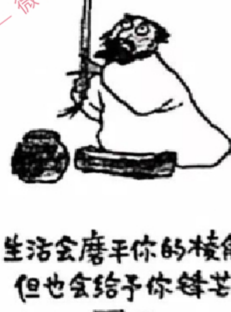
生活会磨平你的棱角,但也会给你锋芒