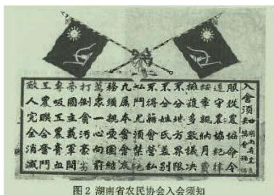
图2 湖南省农民协会入会须知