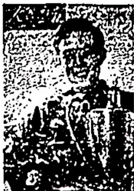
图 3 《人民画报》1959年6月1日(11)封面