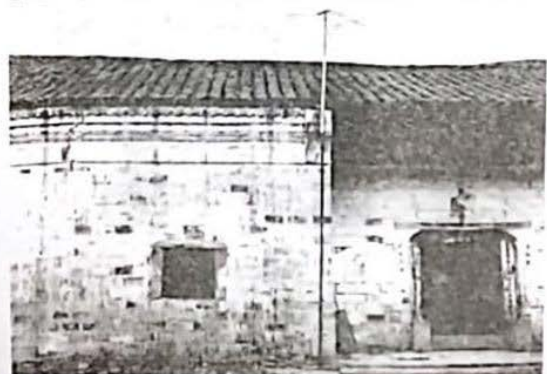
1927年9月，宜昌瓦仓工农革命政府成立。