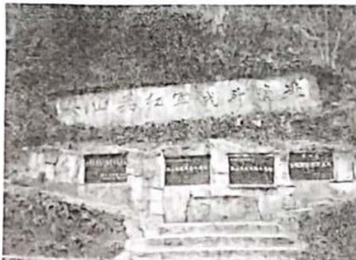
1935年2月，红三军团在遵义取得娄山关大捷