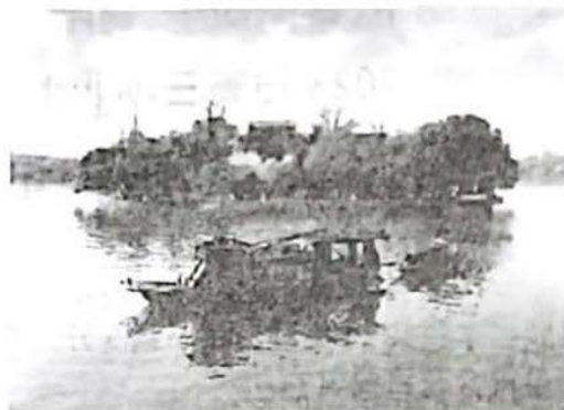
1921年8月，中共一大在嘉兴南湖闭幕