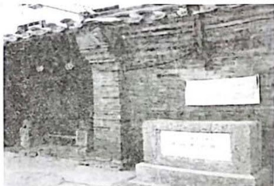
1917年1月，《新青年》编辑部迁至北京。

读万卷书，行万里路。研学旅行让我们走出历史课堂去探寻历史的踪迹，对历史文物眼观耳识、对历史遗址亲身实践，去触摸历史的真实存在，去回味厚重深沉的历史记忆。