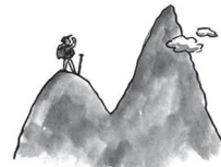
要从一座山攀上另一座更高的山,第一步便是先下山。