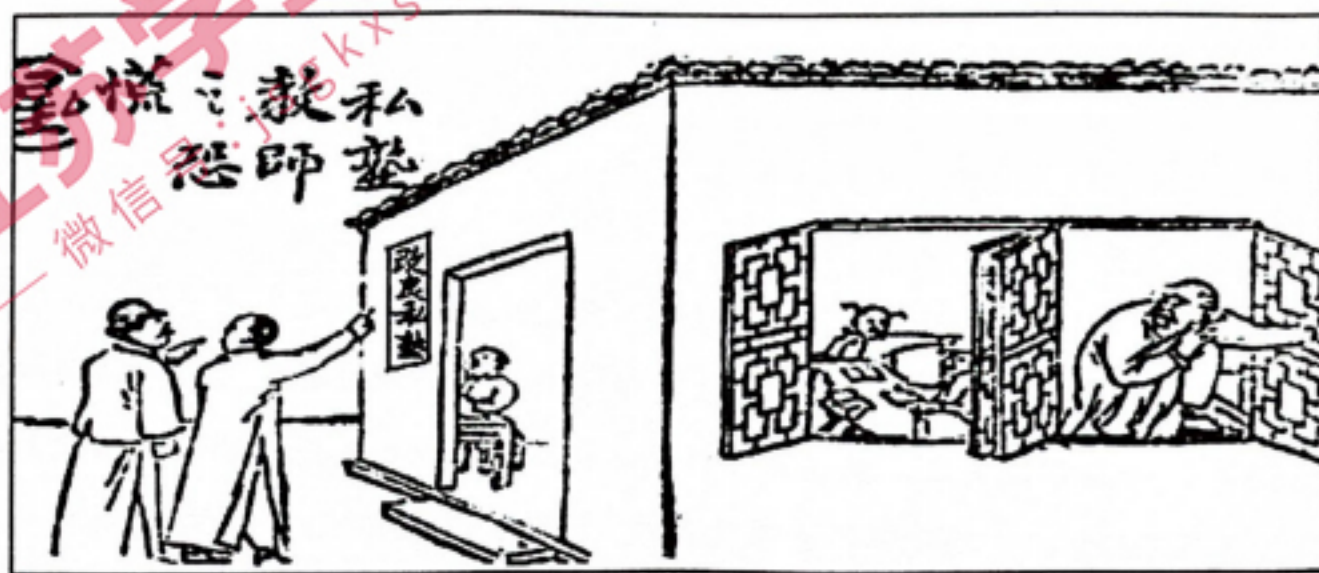
《私塾教师之恐慌》——马星驰《新闻报》1915年10月18日

7. 为进一步推进近代小学教育，1915年初，袁世凯政府出台多条法令，要求各地按照新的要求开展小学教育。下图漫画创作于此时，画中两人朝着标有“改良私塾”的学屋走去，其中一人戴着礼帽，另一人为陪同人员，而私塾内的老先生见此情形，遁窗而逃。这反映了