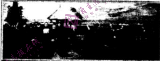
油画《航空报国的楷模——罗阳》（作者：张峻明）