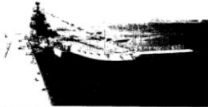
由大连船舶重工集团有限公司建造的中国第一艘国产航母——山东舰。