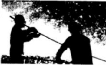
“一代人、一口气、一炉钢”！钢铁工人夜以继日地奋战在炼钢一线。