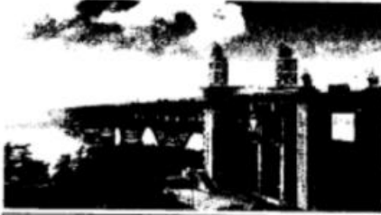
被誉为“争气钢”的鞍钢桥梁钢撑起了南京长江大桥。