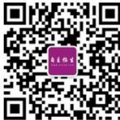
微信扫一扫,快速关注

如需第一时间获取相关资讯及备考指南,请关注自主招生在线官方微信号: zizzsw 。