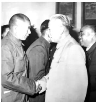
刘少奇同清洁工人时传祥亲切握手