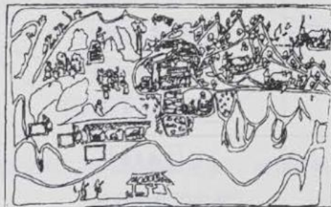
图3 内蒙古和林格尔汉墓壁画描摹