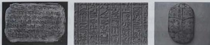
第一把交椅(楔形文字) 第二把交椅(古埃及圣书字) 第三把交椅(甲骨文)