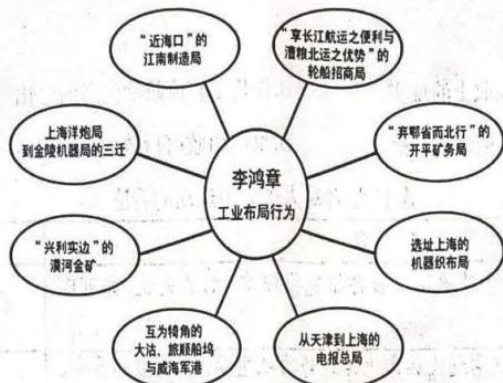
图3 李鸿章的主要工业布局行为图