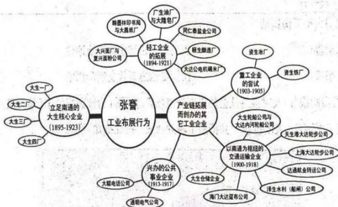
图4 张謇的主要工业布局行为图